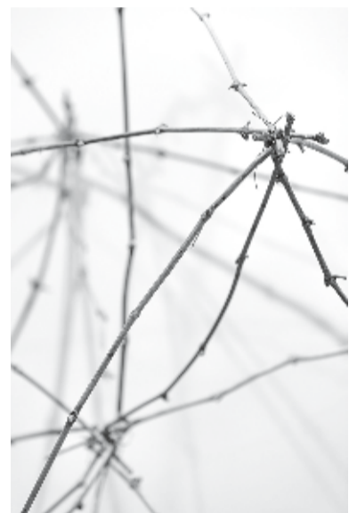
Im Garten der Rebkunst Installation, 2018