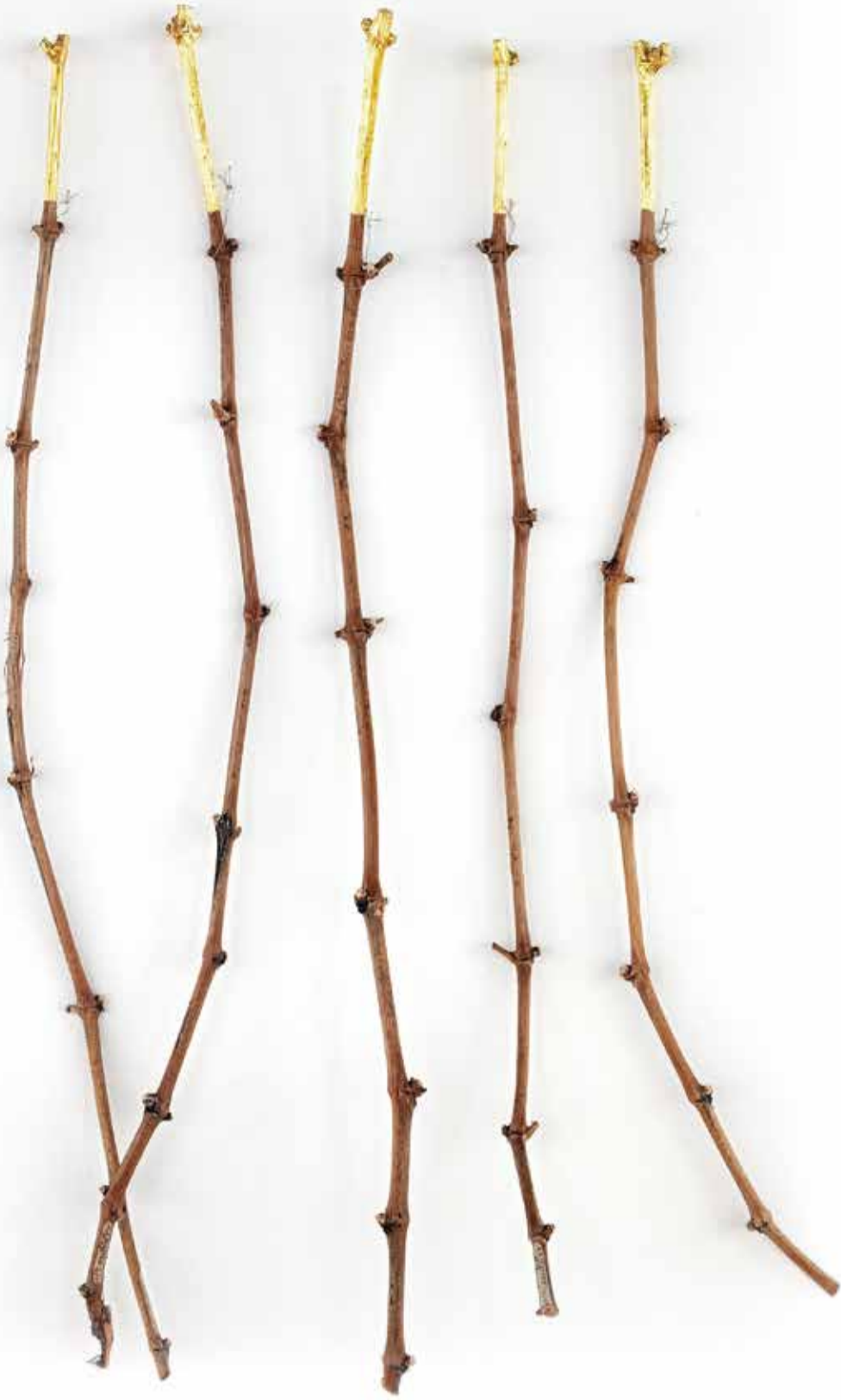
Sarment vergoldet, Ölvergoldung, 45cm, 2018