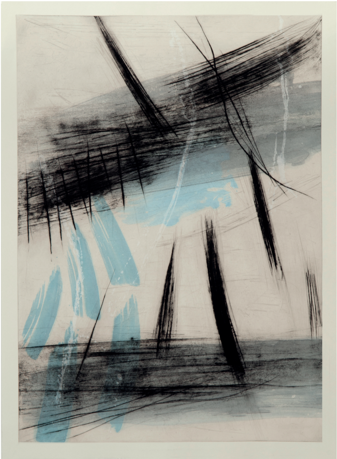
«Rivage», 71 x 100 cm, Pointe sèche sur chine rehaussé, 2018