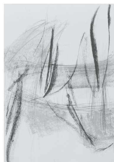
«Rivage», Pointe sèche sur chine rehaussé 59 x 84 cm, 2019