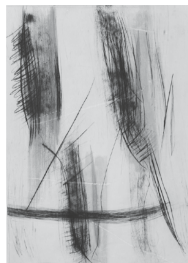
«Rivage», Pointe sèche sur chine rehaussé 59 x 84 cm, 2019

Kantonsmuseum Wallis, Cabinet des Estampes du Musée Jenisch, Musée du Locle, Graphik Sammlung ETH Zürich, Victoria and Albert Museum, London, Trustees of St-Thomas's Hospital