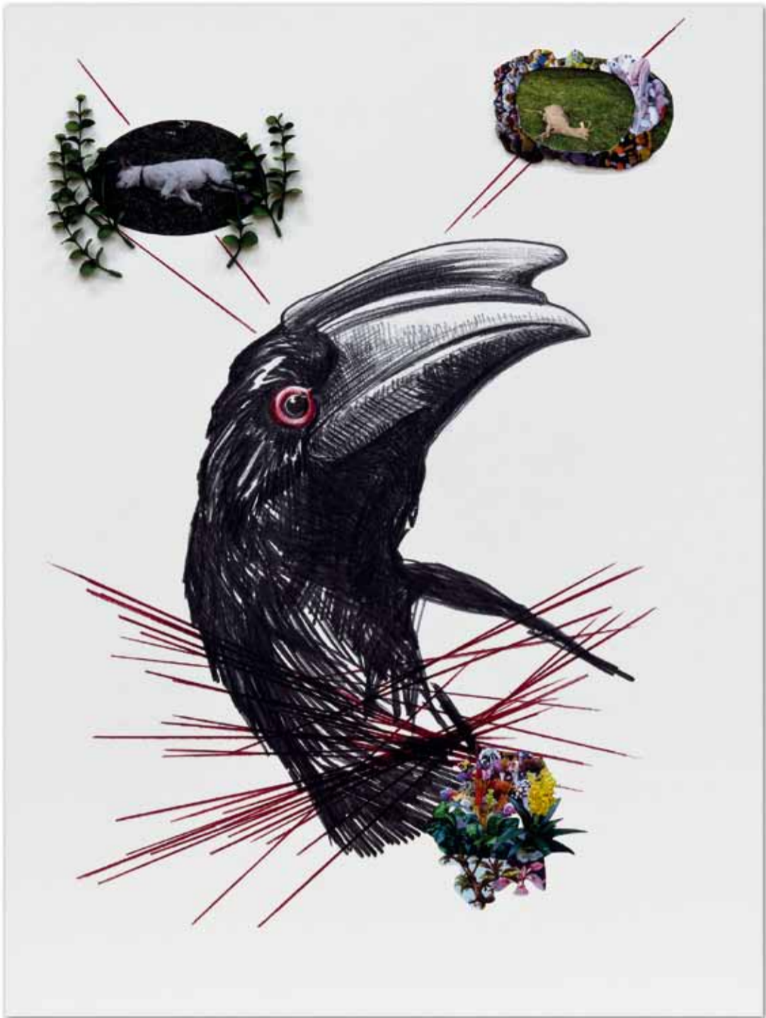
Humboldts Traum I (Nashornvogel), Farbstift und Collage auf Karton, 60 x 80 cm, 2012