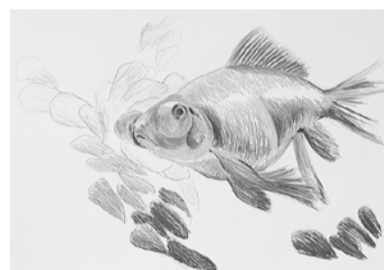
relaxed animals I (Goldfisch), 2011 Farbstift auf Papier, 61 x 86 cm

www.michaelvonbrentano.de www.vitisantiqua1798.ch