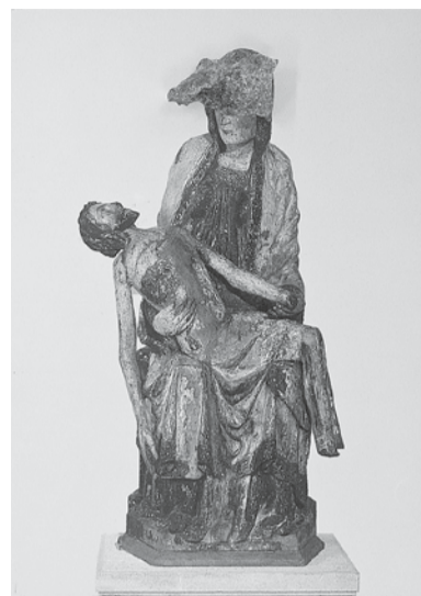
Pietà von Leuk, 2013 Postkarte und violettes Mineral 14,8 x 10,5 x 1,4 cm

Die zehnte Edition der Vitis Antiqua 1798 wurde von dem bayerischen Künstler Michael von Brentano gestaltet. Der Ausschnitt aus der Tierserie «relaxed animals» zeigt das Gesicht eines Affen, der uns mit einem ziemlich menschlichen Ausdruck anschaut. Die Zeichnung aus dem Jahr 2011 erfasst in wenigen Strichen die Wechselbeziehung zwischen Mensch und Kreatur, wobei sich auch hier die Frage stellt, wer wen beobachtet. Worüber staunt der Gorilla? Der Mensch macht sich zum Affen, während die Evolution das Gegenteil behauptet.