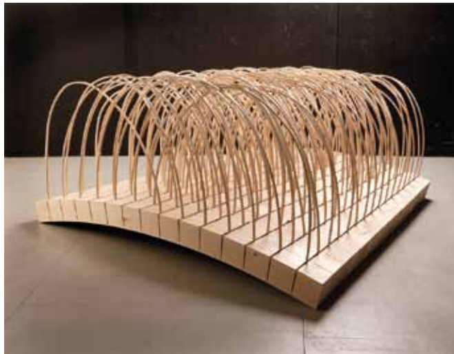
Diverse Skulpturen; Holz / 2012